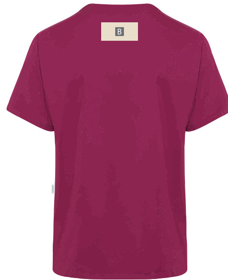
Rückseite oben mittig