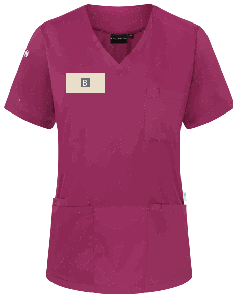
Vorderseite Brust (links)