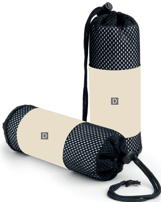
Zeichnungen sind nicht maßstabsgetreu