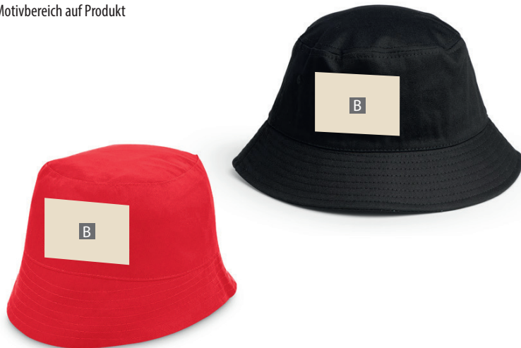
Motivbereich auf Produkt

JPG-Daten beinhalten KEINE Transparenz. Wenn Sie in Ihrem Layout weiße Elemente verwenden, werden diese auch in weiß gedruckt.