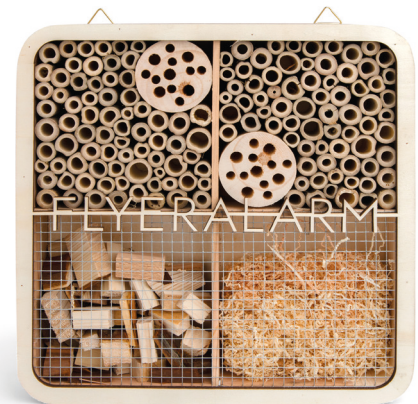
Beispiele Laserschnitt auf Produkt