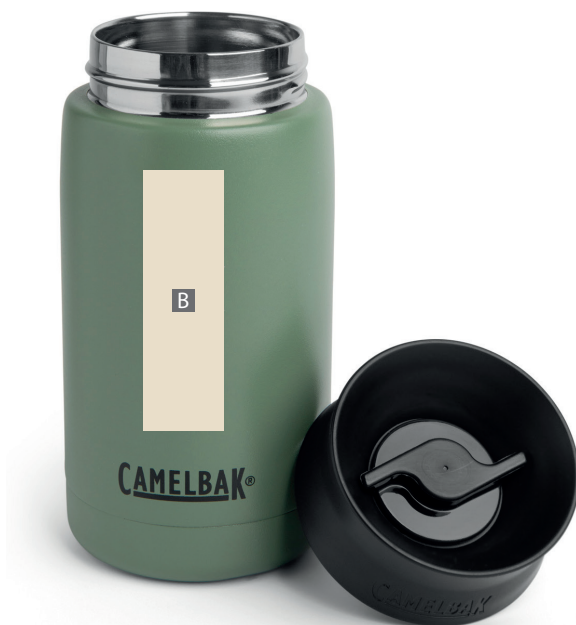
Zeichnungen sind nicht maßstabsgetreu