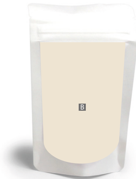
Motivbereich auf Produkt