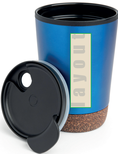
Zeichnungen sind nicht maßstabsgetreu