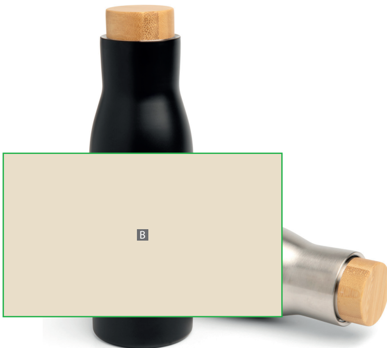
Zeichnungen sind nicht maßstabsgetreu