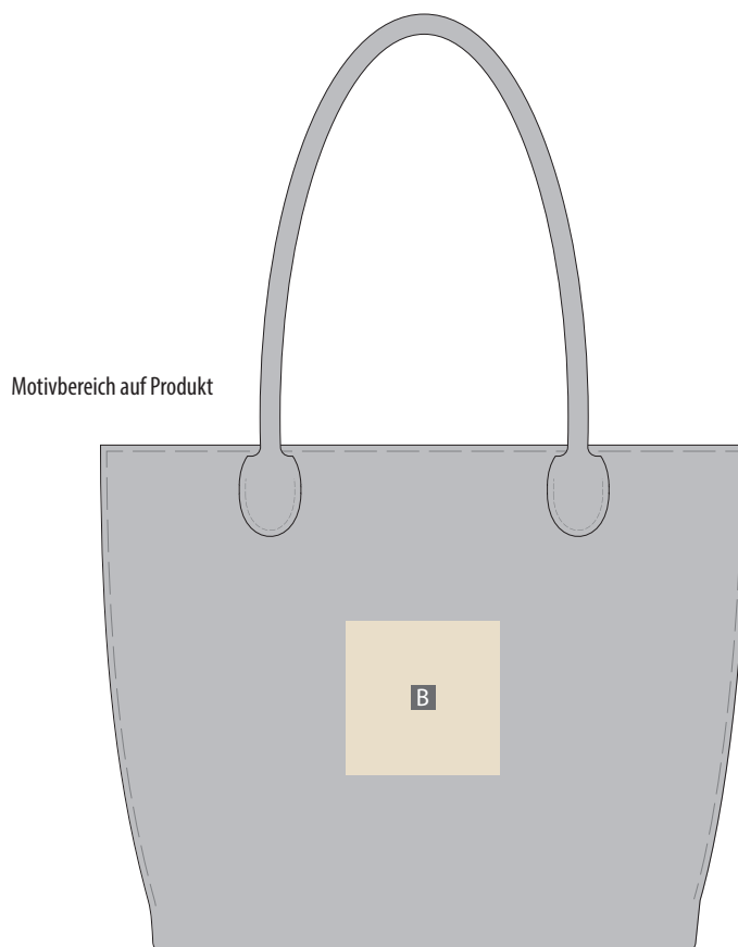
Motivbereich auf Produkt