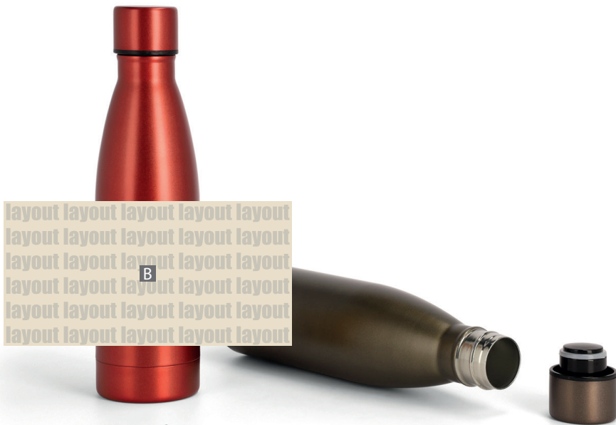
Motivbereich auf Produkt