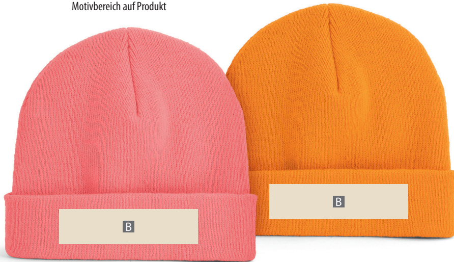
Motivbereich auf Produkt