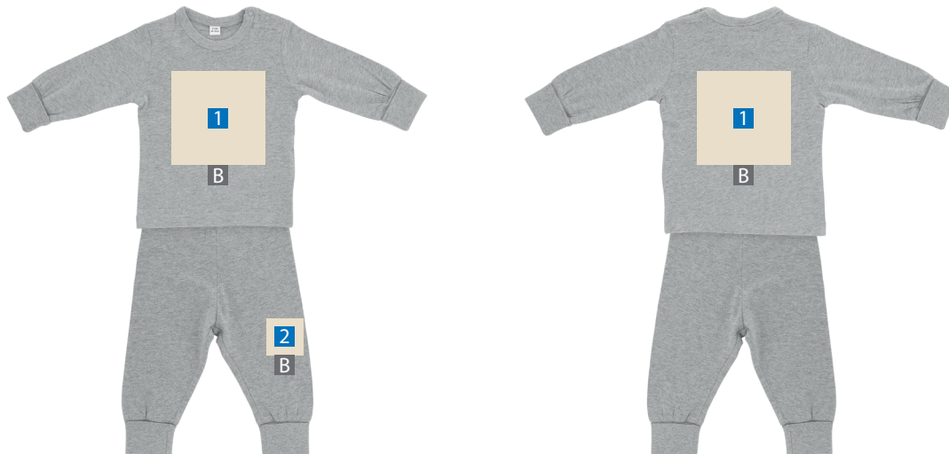
Motivbereich auf Produkt

JPG-Daten beinhalten KEINE Transparenz. Wenn Sie in Ihrem Layout weiße Elemente verwenden, werden diese auch in weiß gedruckt.