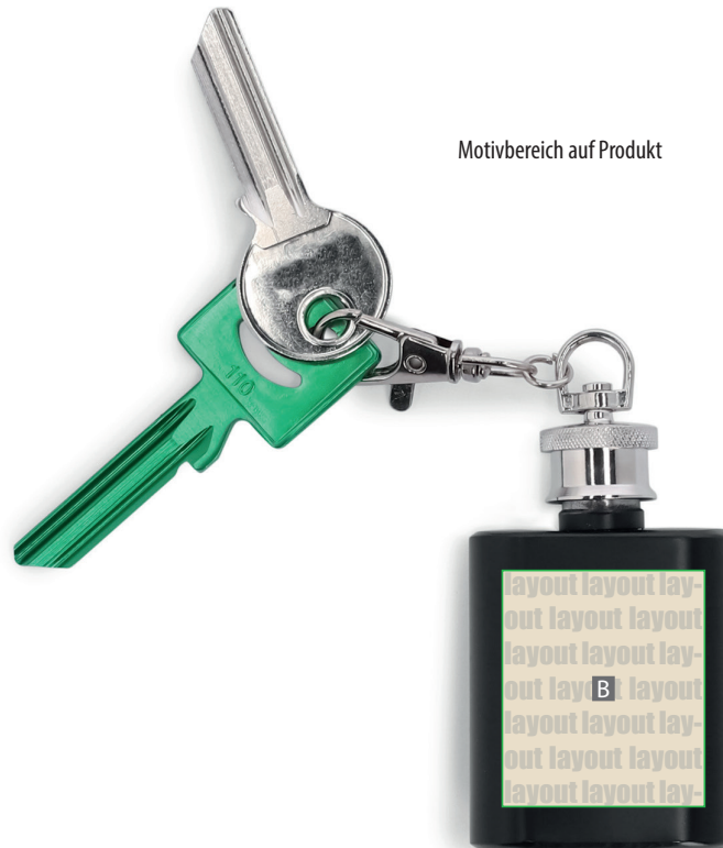
Motivbereich auf Produkt