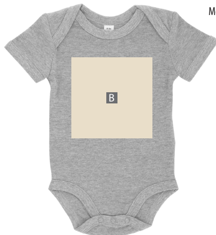
Motivbereich auf Produkt