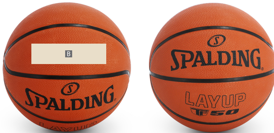
Motivbereich auf Produkt