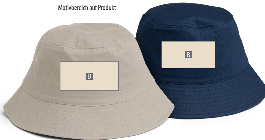
Motivbereich auf Produkt