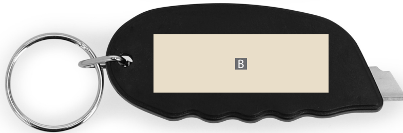
Motivbereich auf Produkt