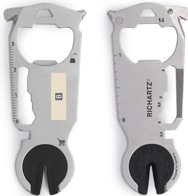
Motivbereich auf Produkt