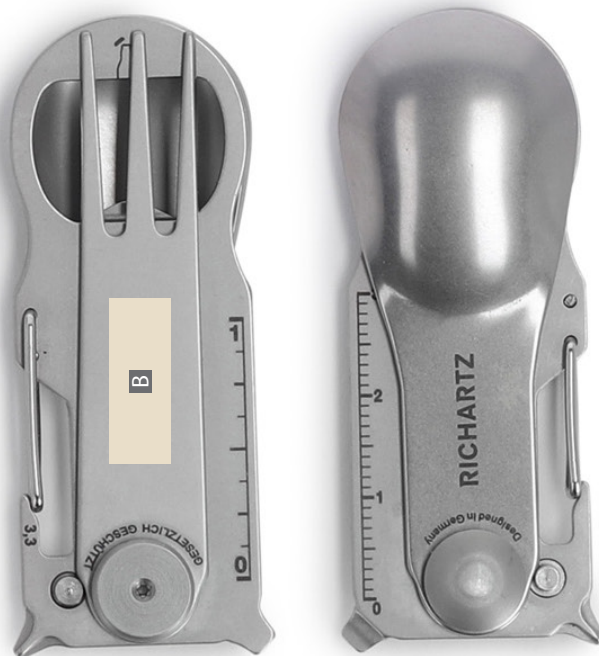
Motivbereich auf Produkt