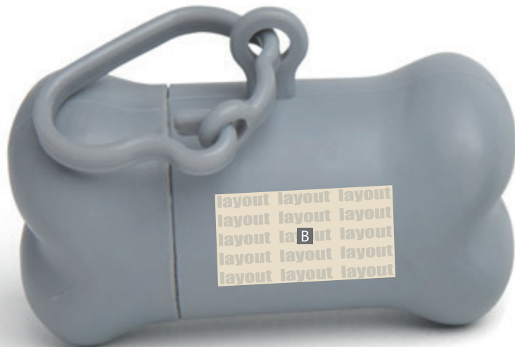
Motivbereich auf Produkt