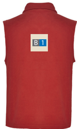
Motivbereich auf Produkt