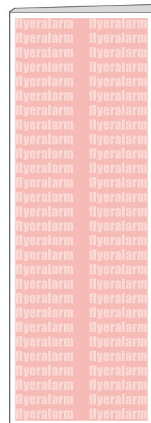
Ansicht des fertigen Produkts

Für die Anlieferung der Druckdaten ist das Datenformat (A) verbindlich, unabhängig von der Größe des angelegten Motivs!