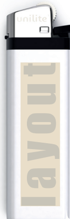
Reibrad - Feuerzeug