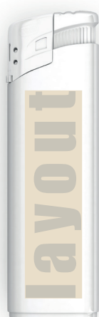
Elektro - Feuerzeug