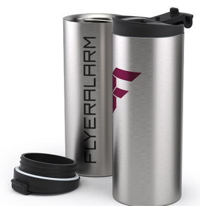
350 ml, Höhe 17,5 cm, Durchmesser 7,0 cm

Die Trinköffnung (B) kann nicht über dem Druckbereich zentriert werden, da sich der Deckel an zwei unterschiedlichen Positionen auf den Becher schrauben lässt. Somit wird die Position der Trinköffnung gegenüber des Drucks immer unterschiedlich sein. Ein Rundumdruck ist nicht möglich. Es bleiben 2 cm unbedruckt.