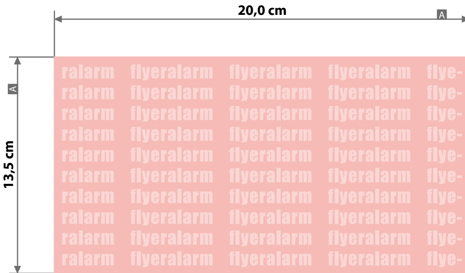
Motivbereich auf Produkt

350 ml, Höhe 17,5 cm, Durchmesser 7,0 cm