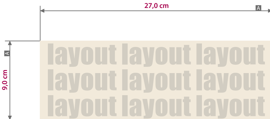
Motivbereich auf Produkt