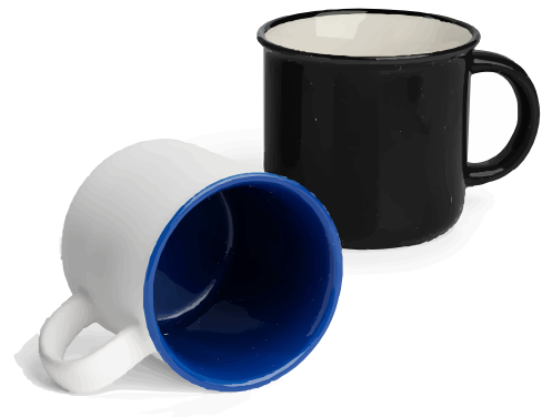
Motivbereich auf Produkt