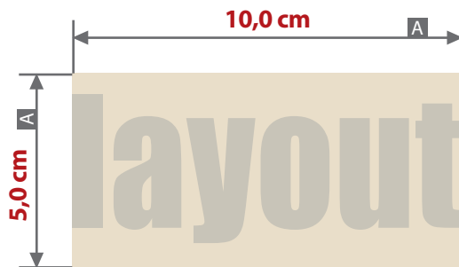
Vorderseite Flat Stick