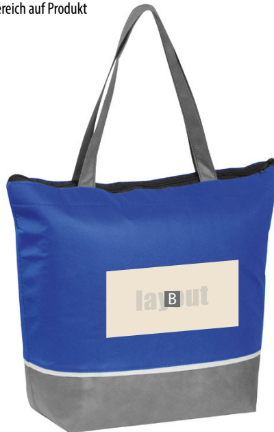
Motivbereich auf Produkt