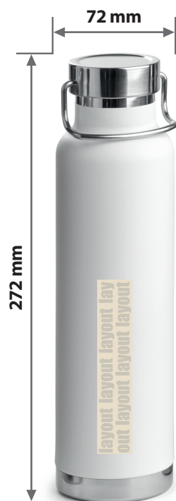
Zeichnungen sind nicht maßstabsgetreu