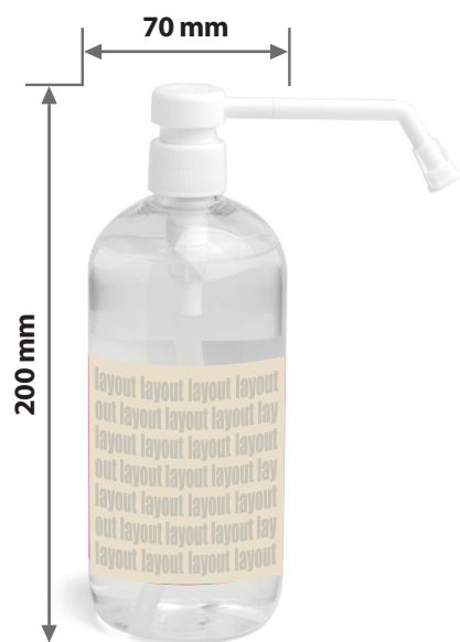
Zeichnungen sind nicht maßstabsgetreu