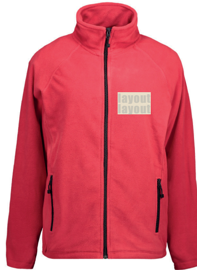
Stickbereich 2 Vorderseite Brust links