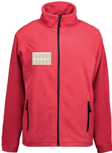
Stickbereich 1 Vorderseite Brust rechts