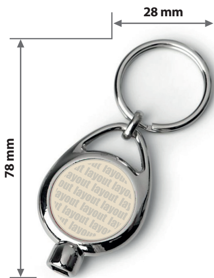
Zeichnungen sind nicht maßstabsgetreu