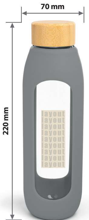
Zeichnungen sind nicht maßstabsgetreu